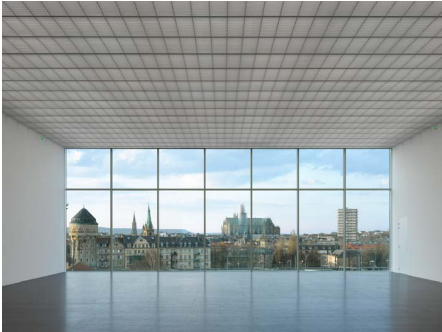
© Centre Pompidou-Metz Shigeru Ban Architects Europe et Jean de Gastines Architectes / Metz Métropole/ Photo Roland Halbe

Elle se termine alors avec la sortie du n° 1, Philosophie des milieux